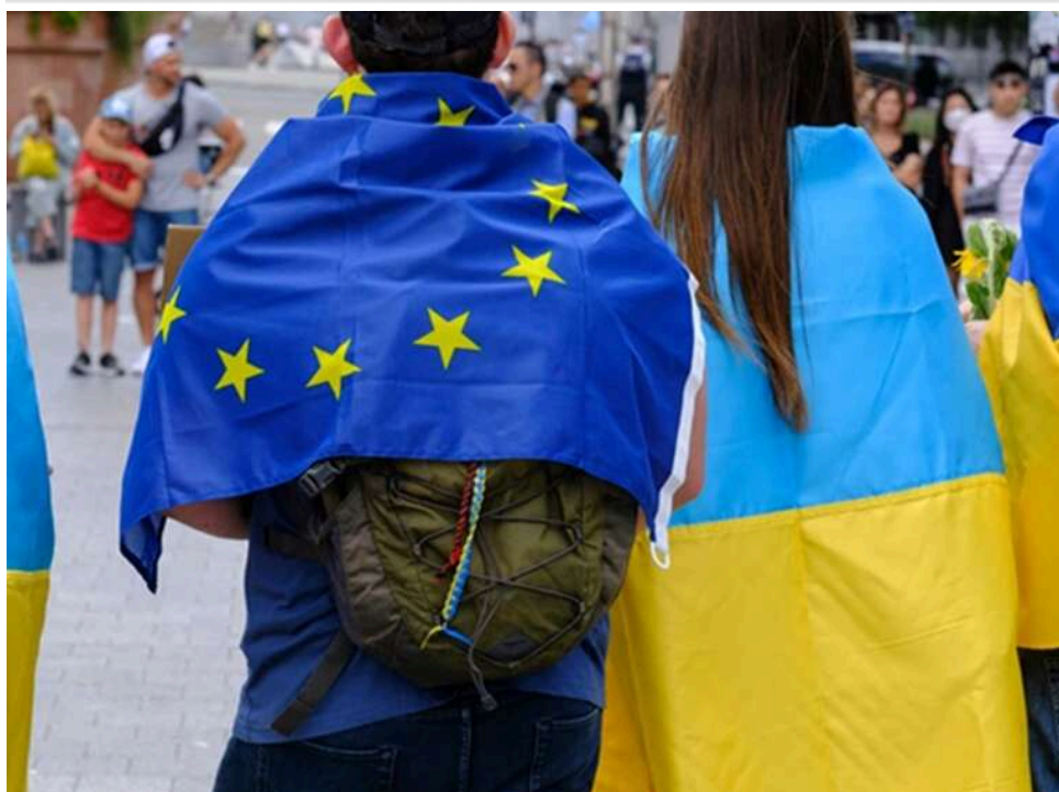
Україна та ЄС обговорили статус біженців після завершення тимчасового захисту

Міністр соціальної політики, сім'ї та єдності України Денис Улютін зустрівся з Європейським комісаром з питань внутрішніх справ та міграції Магнусом Бруннером. Під час зустрічі головною темою обговорення стало майбутнє українців, які перебувають у країнах ЄС через війну.