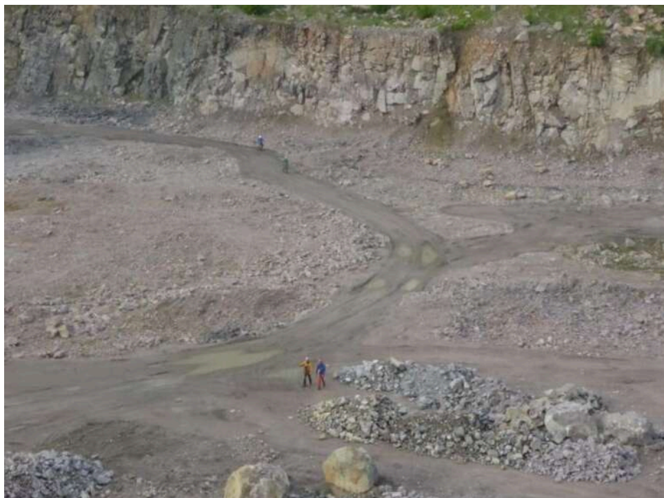
Схеми на 22 мільйони: як «Плесецький гранітний кар'єр» і Василь Горбаль ухиляються від податків

Подивіться які об'єми в Плесецькому на Київщині,- Василь Горбаль,- грузить не подитячому.