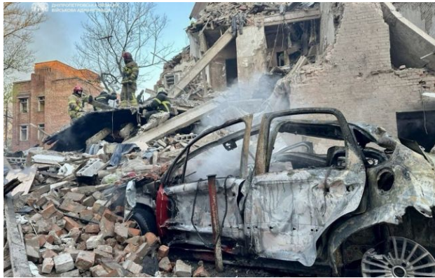
Фото: наслідки атаки на Дніпро, 25 квітня (t.me/dnipropetrovskaODA)

Російські окупанти атакують Дніпро. У місті чути вибухи, зайнялися кілька пожеж і пошкоджено будинки.