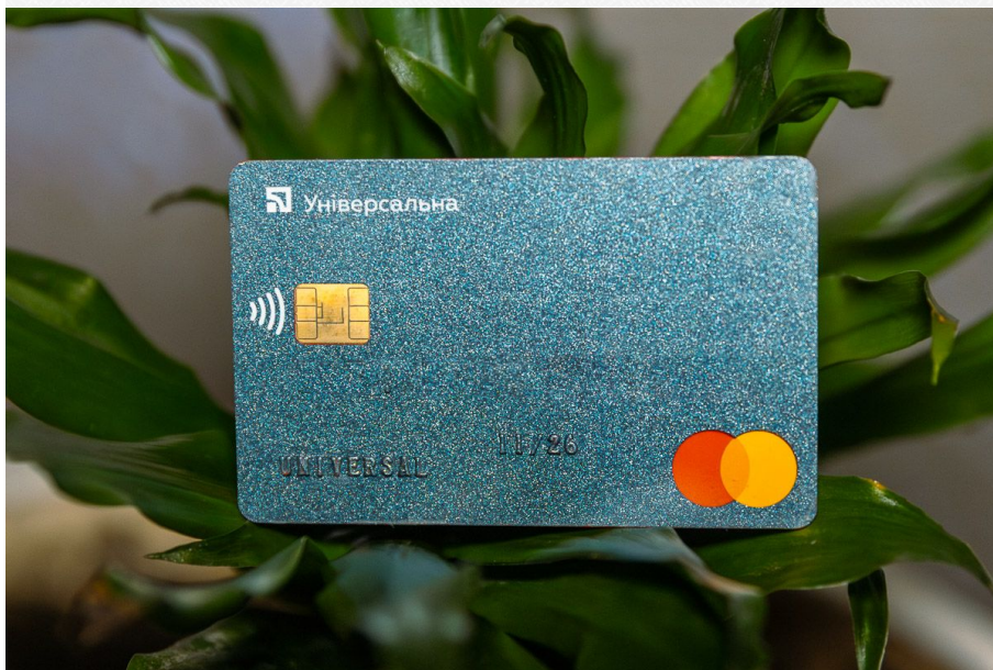
Картка ПриватБанку