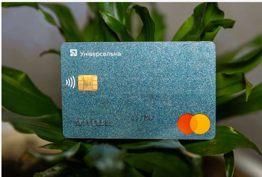
Картка ПриватБанку