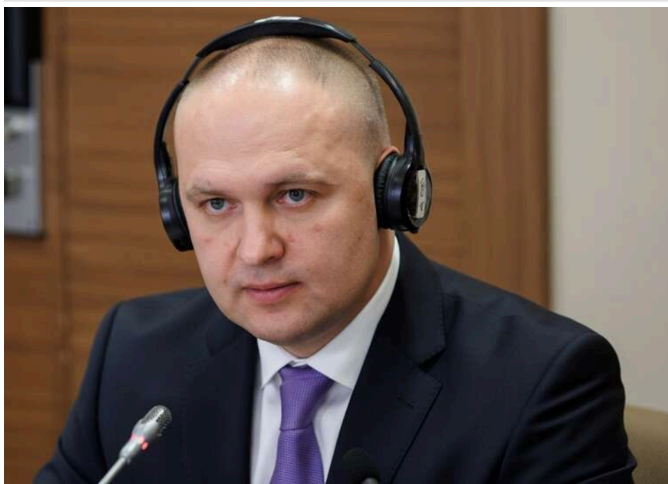
Чужий серед своїх: чому досвід детектива НАБУ дає Мандзію унікальний шанс та водночас створює ризики на митниці

Мабуть, вперше в історії української митниці її головою стає людина, яка з одного боку є для структури абсолютно сторонньою людиною, а з іншого - є людиною, яка як ніхто інший знає митницю зсередини.