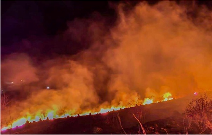
На месте попадания работают профильные службы

Вражеский беспилотник атаковал город, однако, предварительно, обошлось без пострадавших, сообщили власти области.