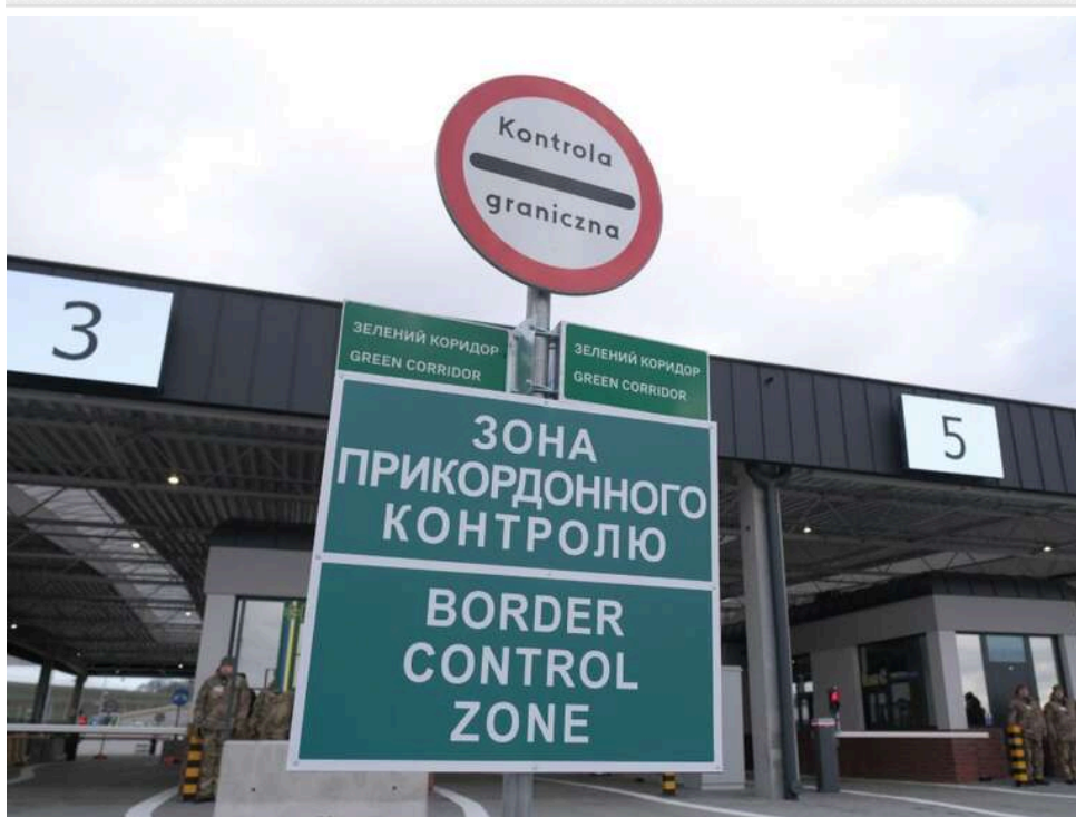
Псевдогуманітарка для ЗСУ: в Ужгороді чоловіка оштрафували за дрон, який так і не доїхав до фронту

Ужгородський міськрайонний суд визнав винним громадянина України у порушенні митних правил через ввезення квадрокоптера DJI Matrice M30T під виглядом гуманітарної допомоги без подальшої передачі військовим.