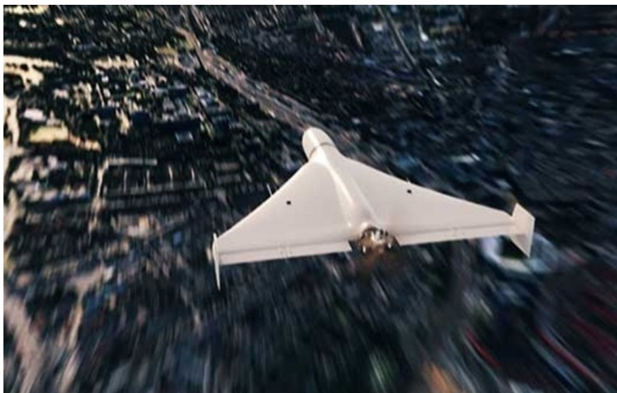
БПЛА атакував Львов