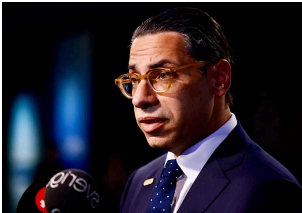
Кіпр закликає Євросоюз до активного втручання у справи Близького Сходу

Європейський Союз повинен відмовитися від ролі стороннього спостерігача на Близькому Сході та почати діяти активніше, заявив міністр закордонних справ Кіпру Константінос Комбос.