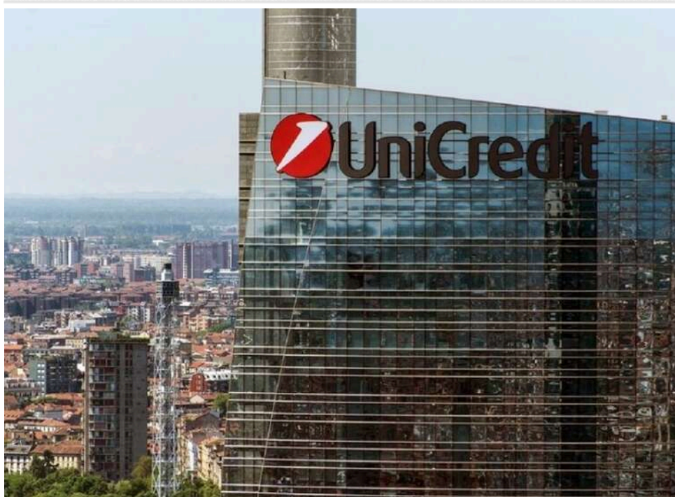
Замість продажу – ліквідація: UniCredit остаточно згортає свій банківський бізнес у Росії

Італійська фінансова група UniCredit ухвалила рішення про ліквідацію своєї банківської мережі в країні-агресорці Росії "ЮніКредит". Італійський банк ще у 2022 році вирішив припинити діяльність у РФ, але до останнього сподівався на продаж своїх активів. І лише тепер група згодилась на ліквідацію своїх банківських структур в Росії замість продажу.