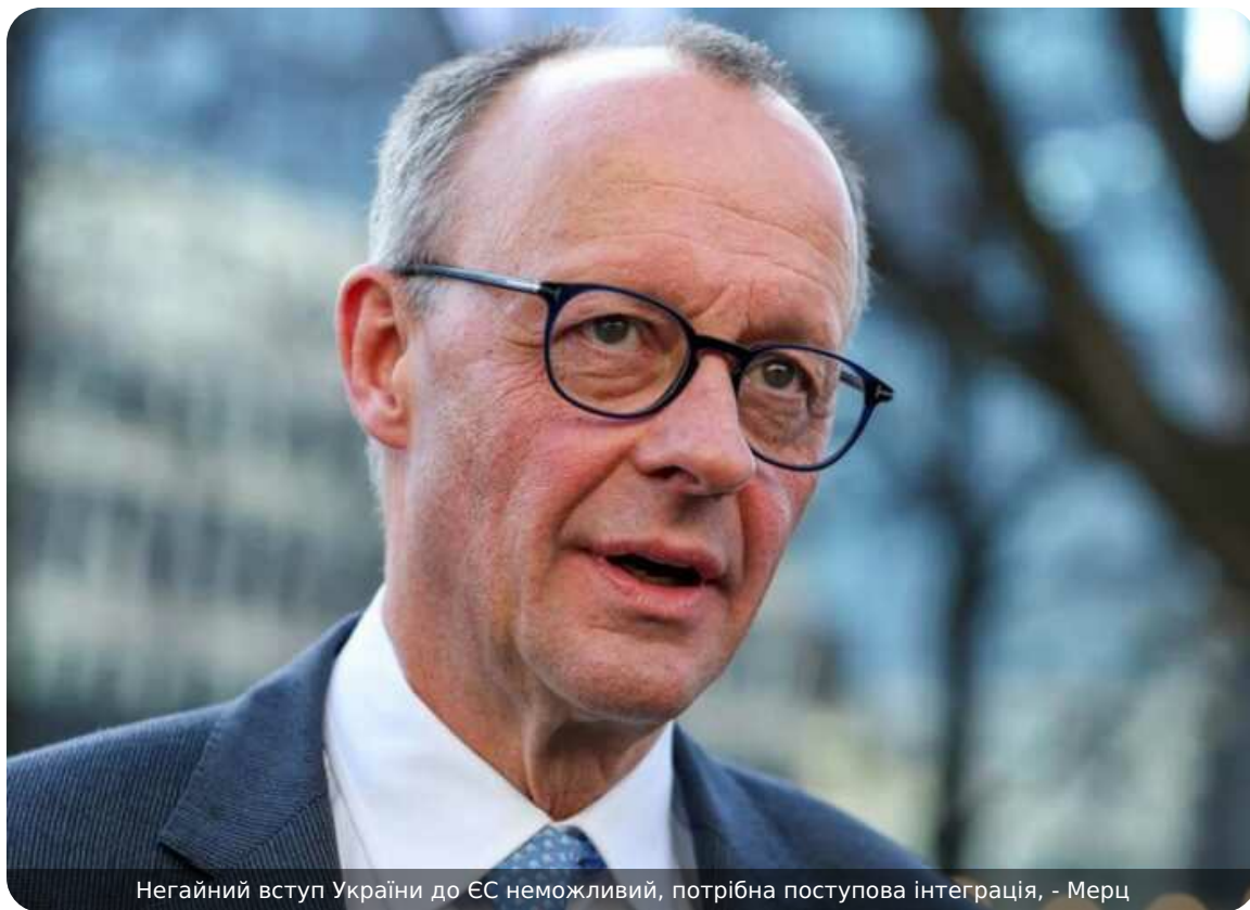
Негайний вступ України до ЄС неможливий, потрібна поступова інтеграція, - Мерц

Канцлер Німеччини Фрідріх Мерц заявив, що Україна має активніше інтегруватися в процеси Європейського Союзу, однак її швидкий вступ до блоку на цьому етапі неможливий.