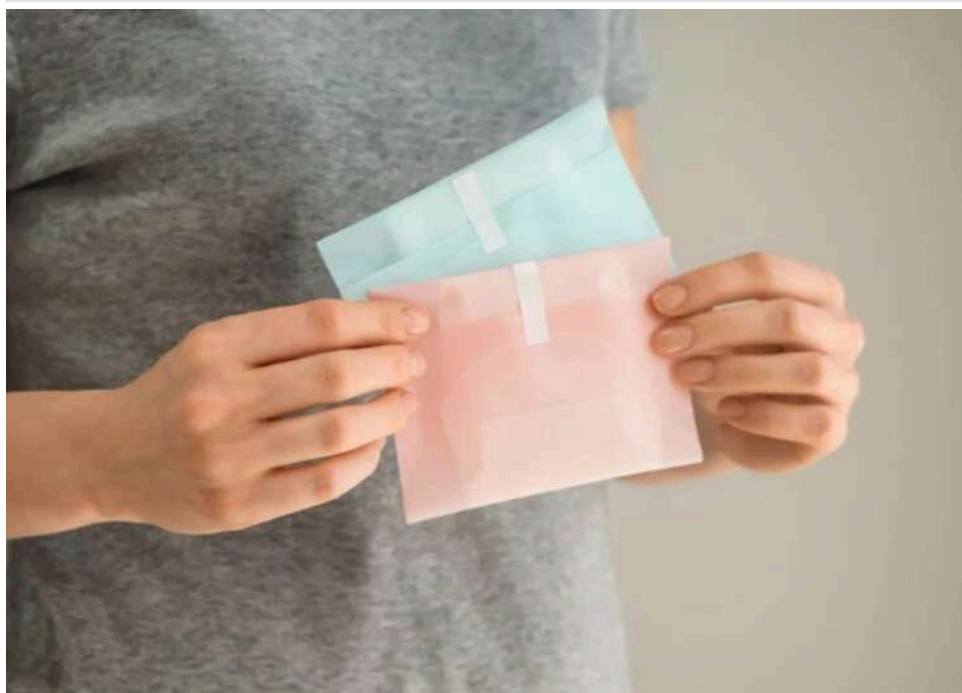
У М'янмі хунта обмежила продаж гігієнічних прокладок

Військовий режим М'янми заборонив продаж і перевезення гінекологічних прокладок для жінок, стверджуючи, що їх у медичних цілях використовують «повстанці».