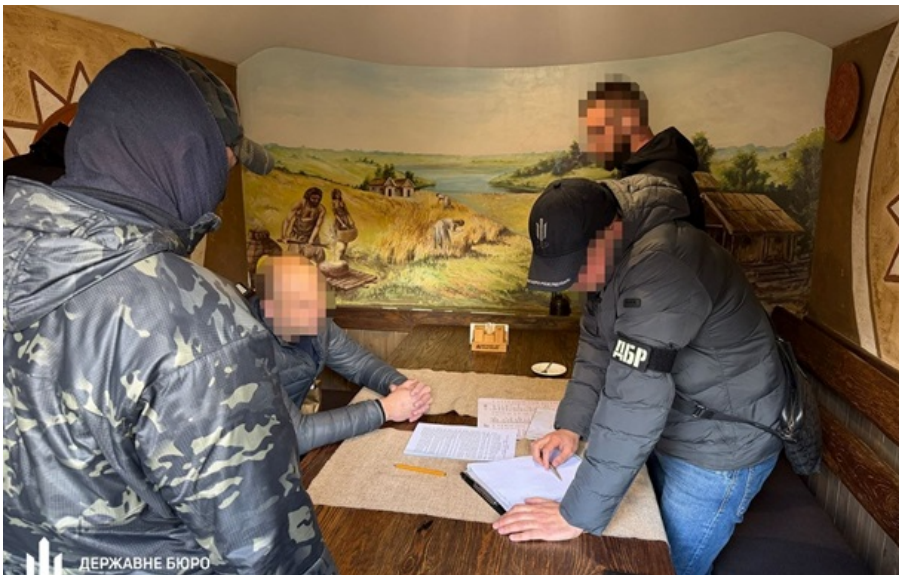
Посадовцю Укрзалізниці обрали запобіжний захід

Заступник керівника одного з департаментів Укрзалізниці обіцяв погодити демонтаж колії за 100 тисяч доларів.