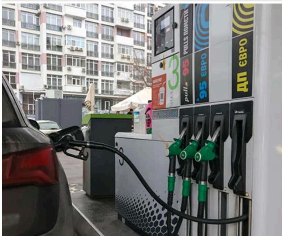
Паливна пастка: як мережі АЗС заробляють мільярди на штучній паніці та війні в Ірані

Дивіться, як працює брудна гра з цінами на пальне.