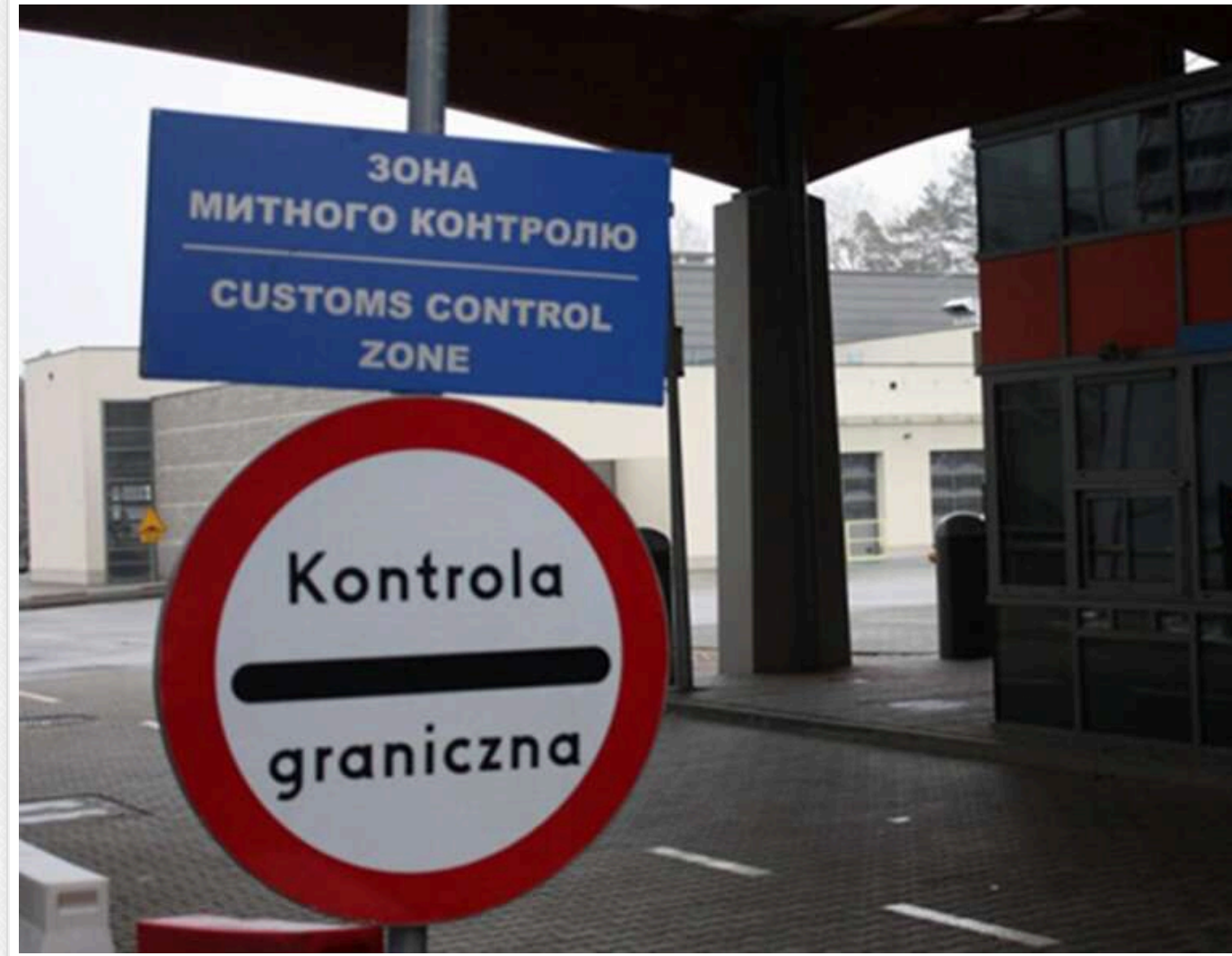
Посилка обернулась судом: у Львові конфіскували CBD-товари з Польщі через психотропні речовини

Обережно з посилками: митниця конфіскує CBD-товари з-за кордону.