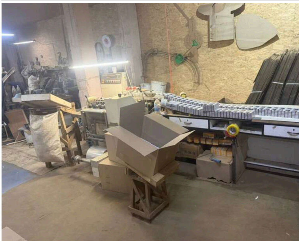
Нічний рейд на Черкащині: ДСР та БЕБ ліквідували потужну лінію з виробництва нелегальних сигарет

Після допису про греків подзвонили поважні люди та просили передати читачам, що в Україні теж не всі дурня валяють.