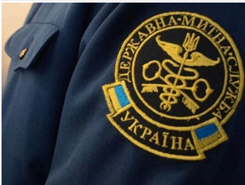
«Ложки не існує»: чому конкурс на голову Митниці називають театральною постановою для двох акторів

«Не намагайся зігнути ложку. Це неможливо. Спершу зрозумій головне: ложки не існує.»