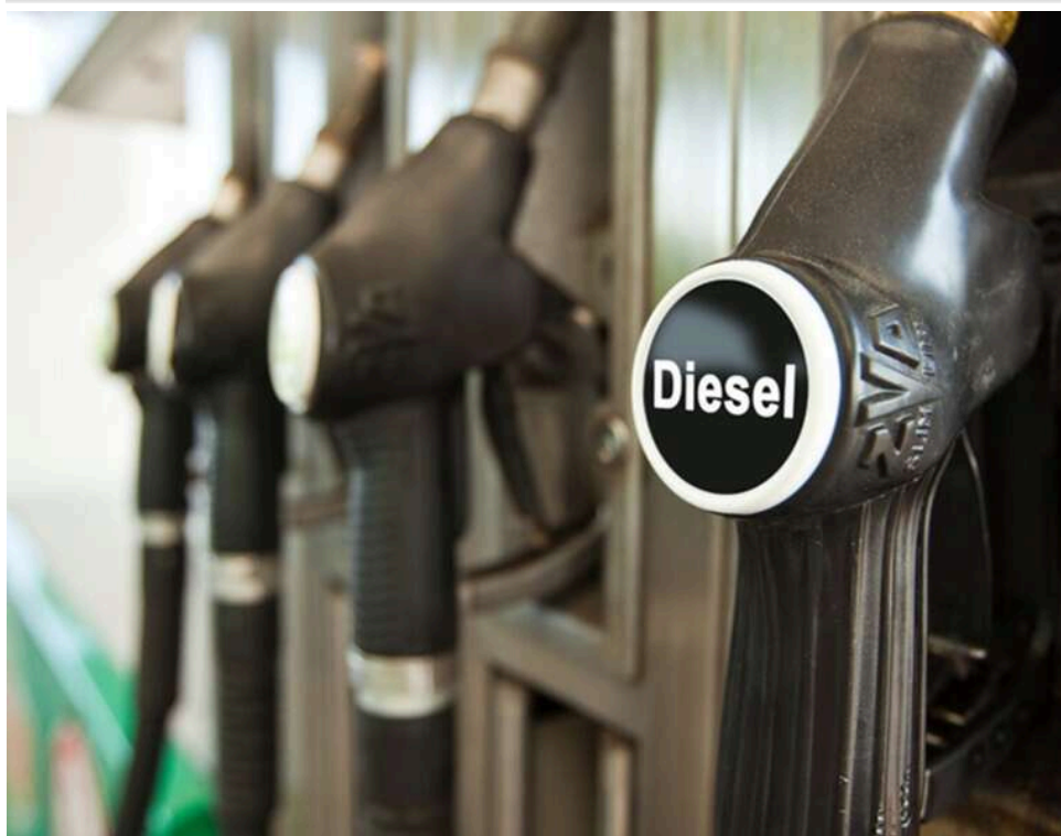
Дизель по 100 гривень: стрибок гуртових цін у Литві штовхає український паливний ринок до історичного максимуму

Питання зростання вартості дизелю в Україні до 100 гривень йде фактично на дні.