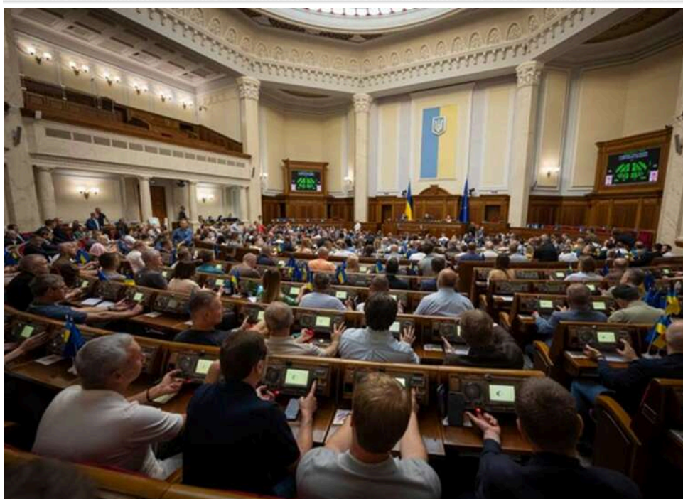
Голоси в обмін на імунітет: Депутати «Слуги народу» вимагали зупинити розслідування НАБУ перед важливими голосуваннями

В ЗМІ нагадують про важливу деталь: нові підозри депутатам залежать від генпрокурора Кравченка.