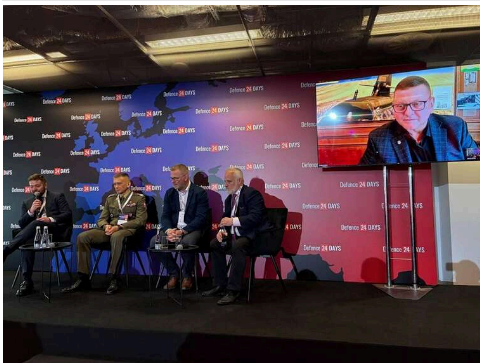
Україна стає заручником демографії, а завершення війни – менш очевидним, - Залужний

Завершення війни в Україні «стає все менш очевидним», а країна все більше опиняється в заручниках власної демографії, заявив Залужний.