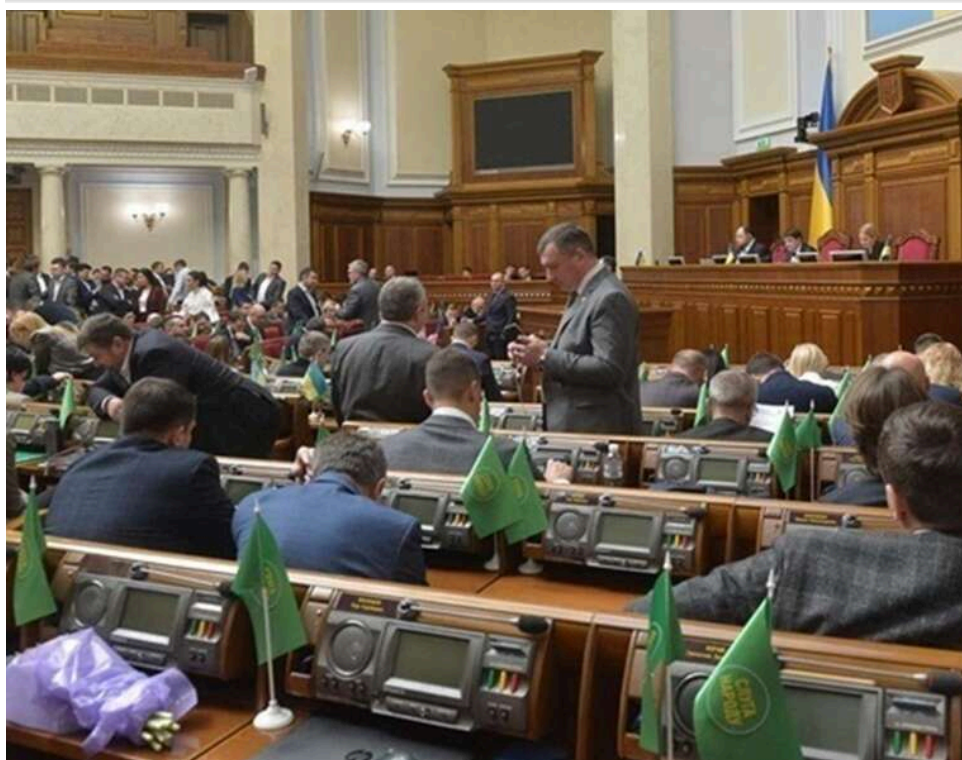
Блеф чи політичні обіцянки: НАБУ та САП публічно відкинули можливість «компромісів» із нардепами від «Слуги народу»

Трохи неочікувано, але найбільший резонанс в моїй статті для ZN.UA «Згадати «турборежим». Як парламент прийматиме антисоціальні податкові закони. Спойлер — за гроші» викликала частина про заповнення «Слуг» з боку керівництва фракції про зменшення активностей НАБУ та САП стосовно їх «діяльності».