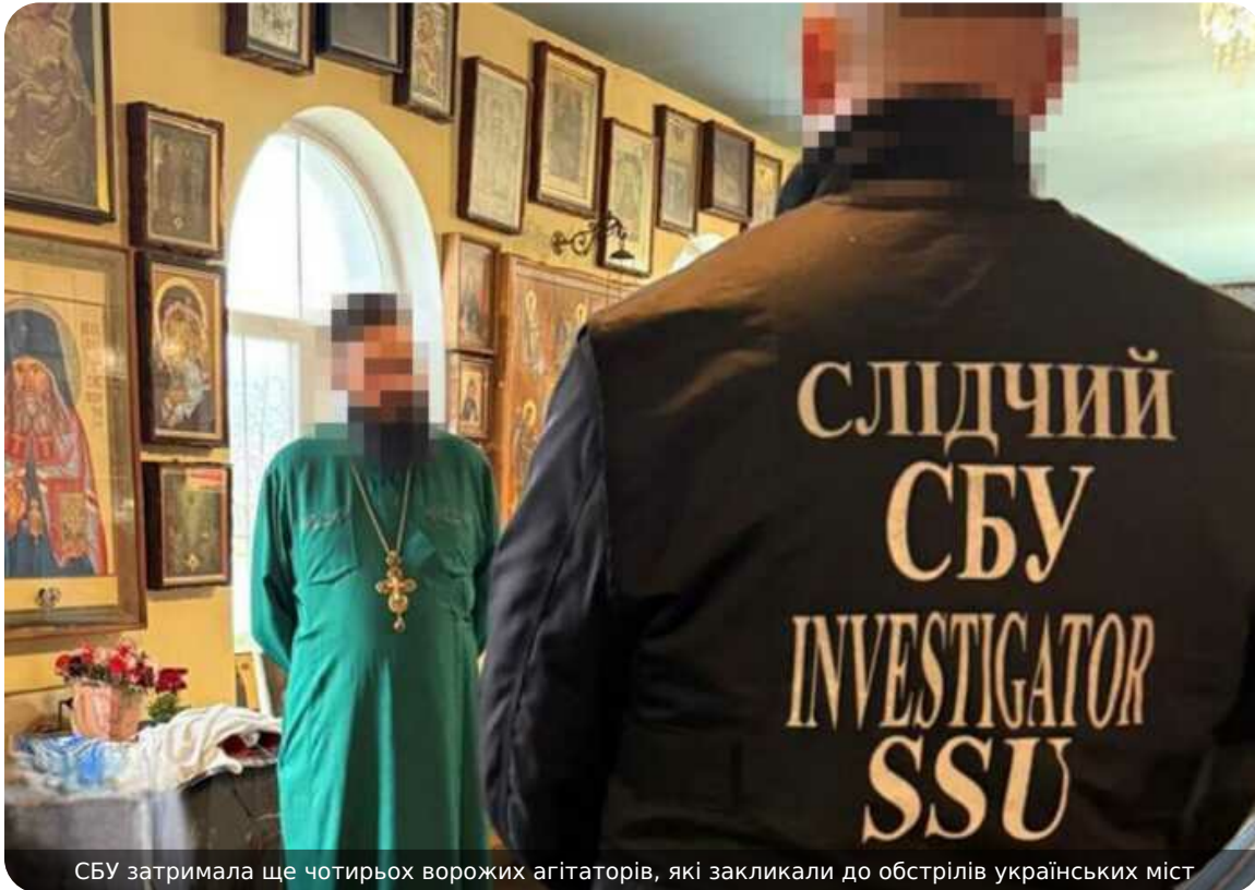
СБУ затримала ще чотирьох ворожих агітаторів, які закликали до обстрілів українських міст

Служба безпеки затримала ще 4 ворожих агітаторів у різних регіонах України. Зловмисники підтримували збройну агресію РФ, закликали обстрілювати українські міста і катувати українських військовополонених.