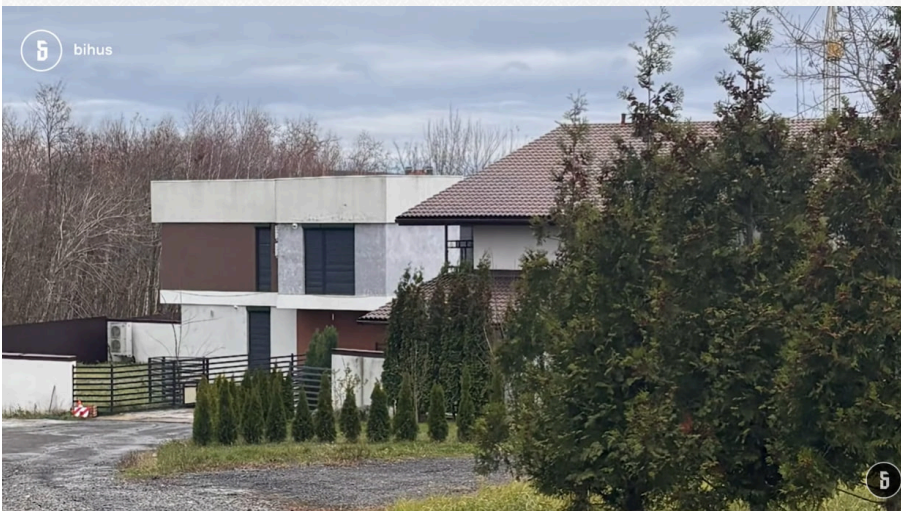
Фото: таунхаус в Ужгороді