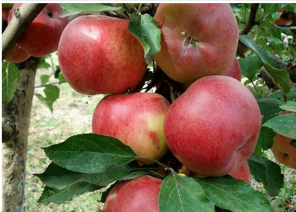
Урожай плодових дерев в Україні може впасти до 40% через весняні температурні коливання

Урожайність плодових дерев може знизитися на 40% через різкі коливання температури цієї весни.