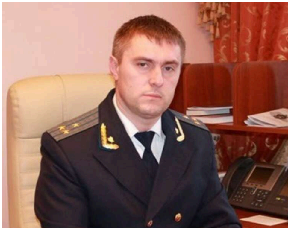
Парковка замість скверу: заступник прокурора Закарпаття Шимон нищить зелену зону заради власної нерухомості

Іван Шимон, щойно призначений першим заступником прокурора Закарпатської області, уже перетворився на одну з найбільш скандальних постатей регіону.