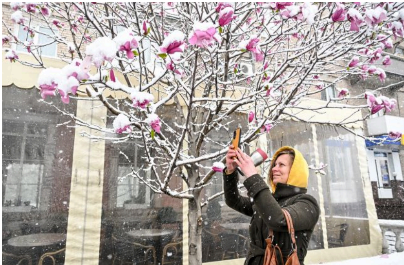
Погода в квітні не перестає дивувати