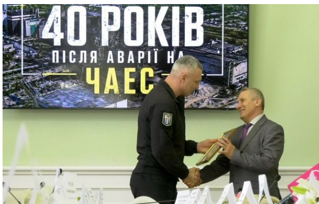
Кличко зустрівся з ліквідаторами ЧАЕС

До 40-х роковин трагедії на Чорнобильській АЕС Київ виплатив щорічну одноразову матеріальну допомогу 42 тис. киян, які постраждали внаслідок катастрофи.