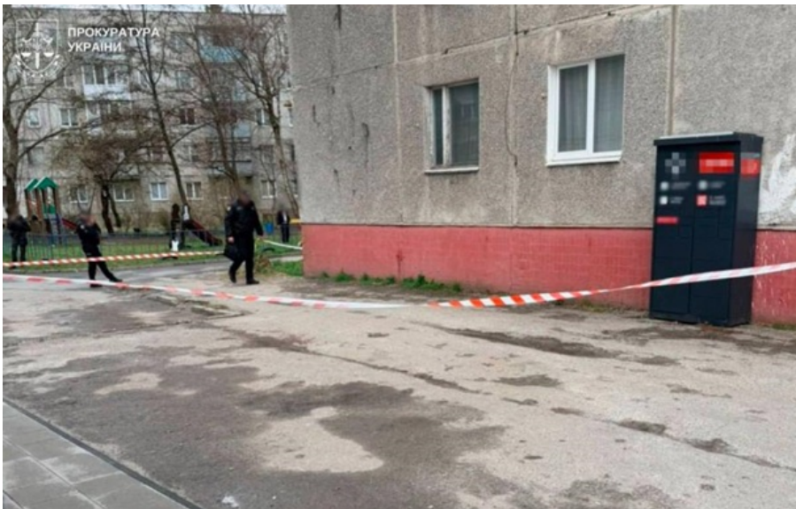
Во Львове задержали убийцу военного ТЦК

Полиция задержала таможенного инспектора, который смертельно ранил военнослужащего ТЦК во Львове.