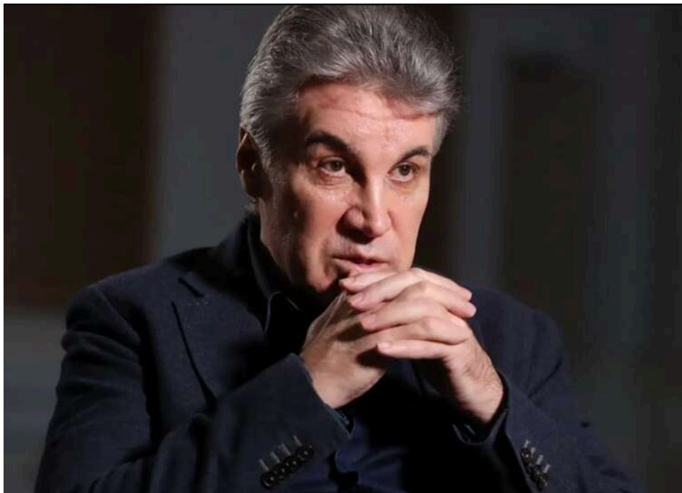
У Москві помер російський пропагандист Олексій Піманов

23 квітня у Москві раптово помер російський пропагандист та телеведучий Олексій Піманов. У журналіста, який підтримував путінський режим, через що потрапив під санкції Європейського Союзу та України, зупинилося серце на 65-му році життя.