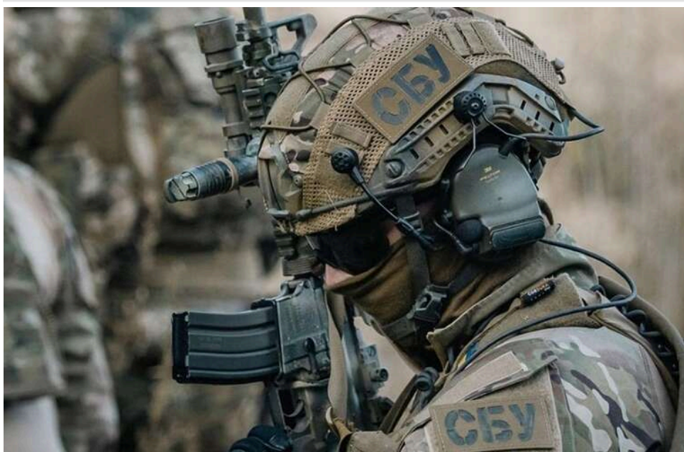
СБУ затримала чотирьох проросійських агітаторів у різних регіонах України

Служба безпеки України затримала чотирьох ворожих агітаторів у чотирьох українських регіонах. Затримані підтримували російську агресію, закликали до обстрілів України та катування військовополонених українців.