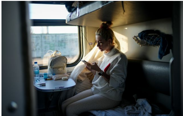
Фото: Жіночі купе (Getty Images)

"Укрзалізниця" розширює кількість жіночих вагонів у поїздах через те, що вони користуються високим попитом серед пасажирів. З 1 травня такі купе з'являться ще на трьох маршрутах.