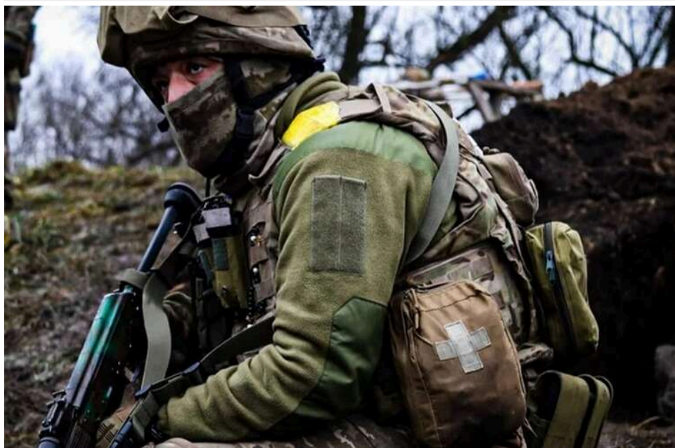
Ситуація на фронті: понад 110 бойових зіткнень за день, окупанти масовано атакують на Покровському та Костянтинівському напрямках

Станом на 16:00 24 квітня кількість атак росіян становить 112.