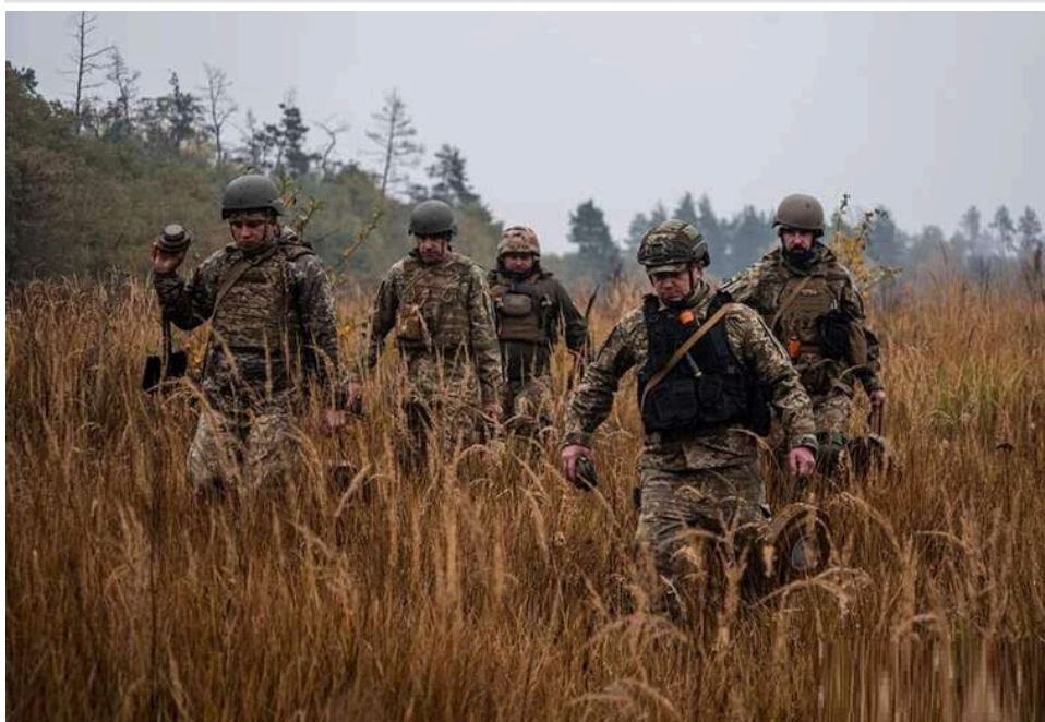
«Управлінський сором»: Командування Об'єднаних сил відреагувало на жахливі умови та голод у 14-й ОМБр

Ситуація із забезпеченням позицій військовослужбовців 14-ї омбр – це жахливий «управлінський» сором.