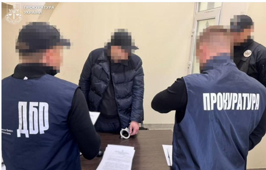
Инспектору Львовской таможни сообщено о подозрении в убийстве военнослужащего