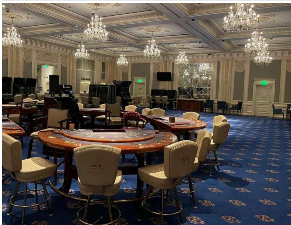
Офшори, крипта та естонські фірми: як тіньовий гральний бізнес відмив мільярди гривень

Гра закінчилася: прокуратура викрила мережу нелегальних онлайн-казино з оборотом у 5 мільярдів гривень.