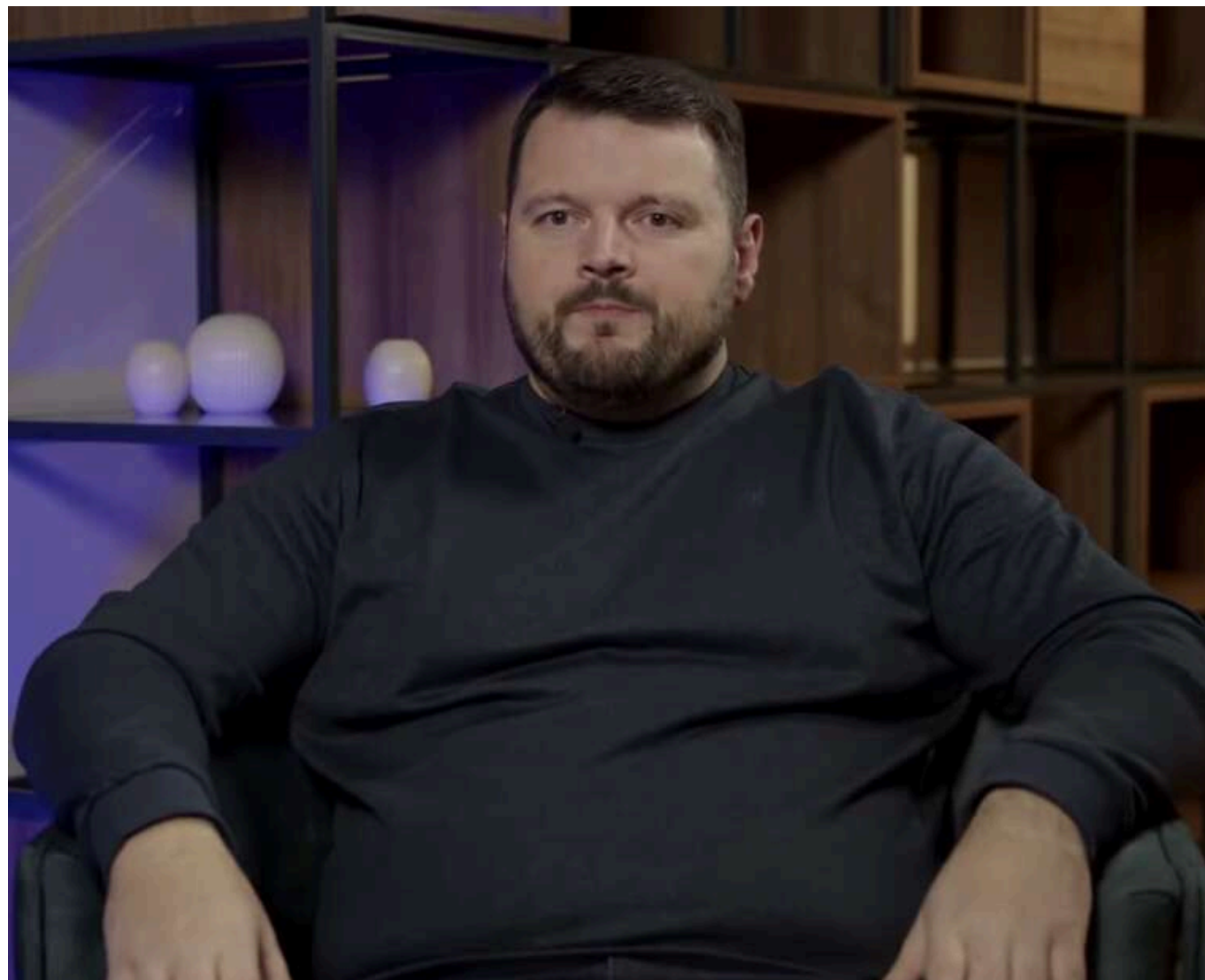
Новий скандал у оборонці: зафіксована НАБУ розмова може розкрити схему фінансування «антикорупціонерів» та монополізацію ринку БПЛА