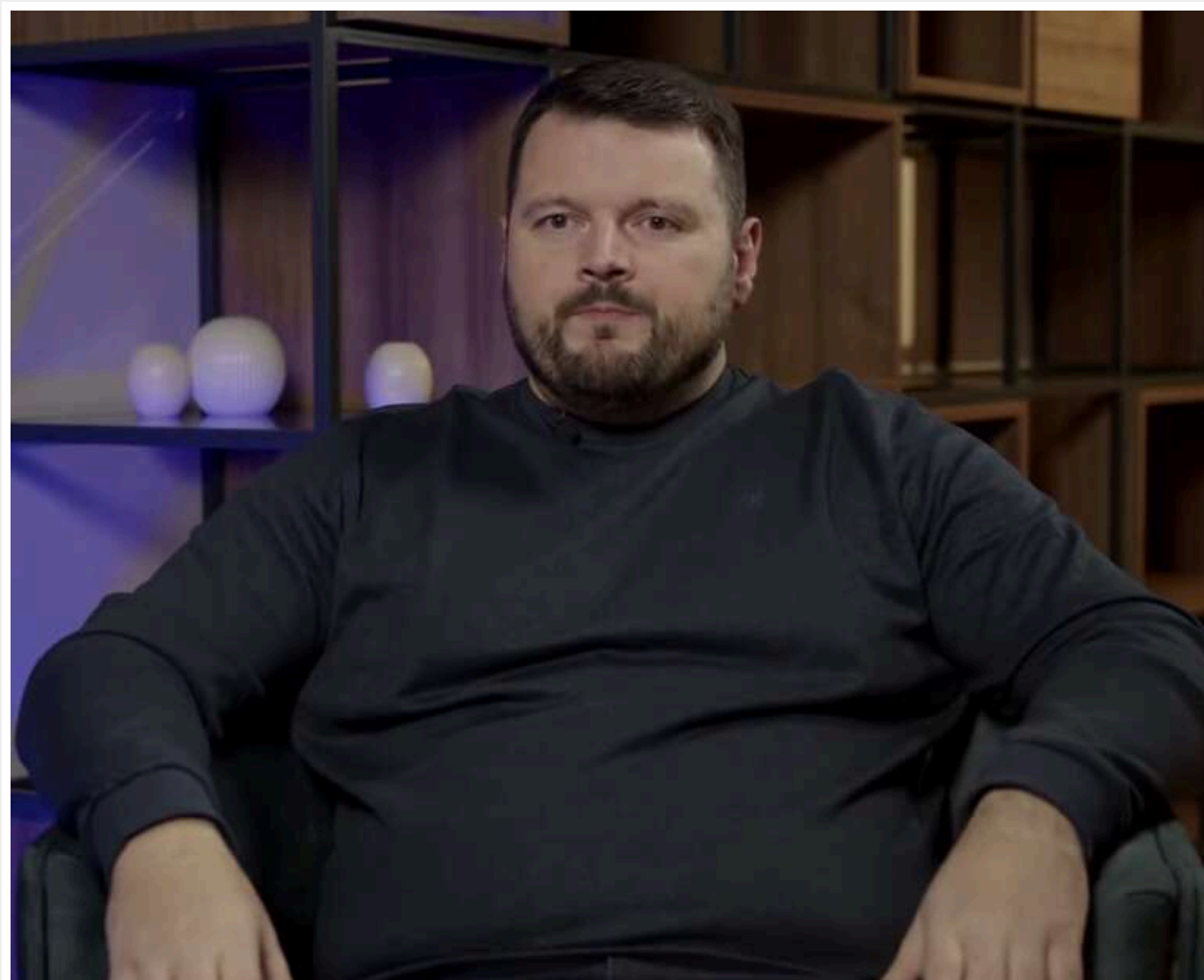
Новий скандал у оборонці: зафіксована НАБУ розмова може розкрити схему фінансування «антикорупціонерів» та монополізацію ринку БПЛА