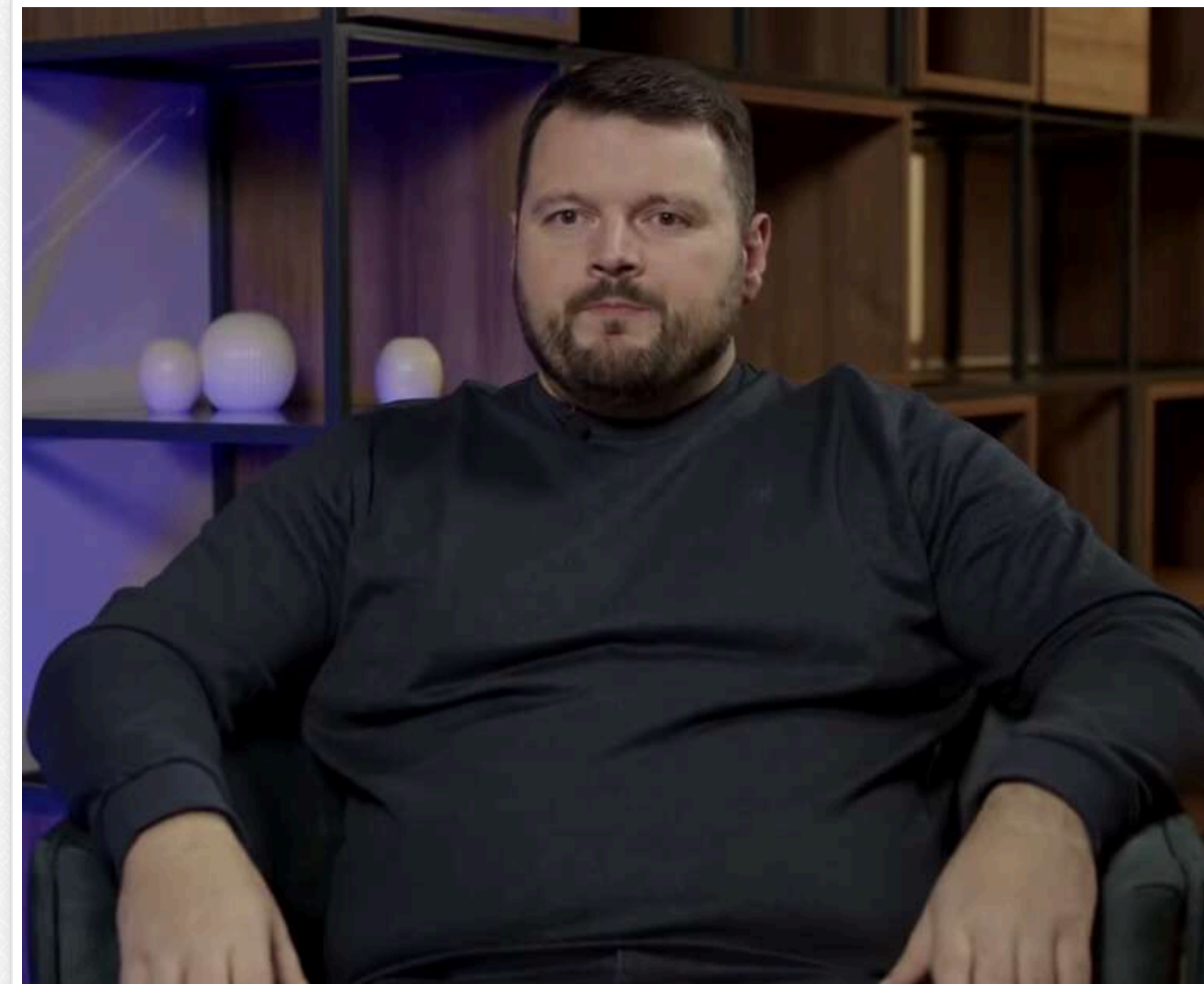
Новий скандал у оборонці: зафіксована НАБУ розмова може розкрити схему фінансування «антикорупціонерів» та монополізацію ринку БпЛА

Читати на руском Read in English Додати як бажане джерело в Google