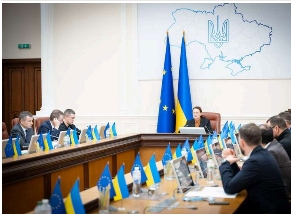
Бюджетний розрив у 52 мільярда доларів: Мінфін попереджає про можливе скорочення соцвиплат