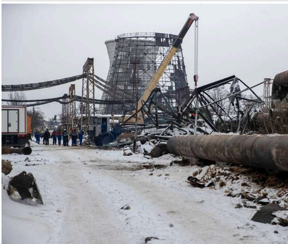
Дарницький район Києва може залишитися без тепла через неможливість швидкого відновлення ТЕЦ

У Дарницькому районі Києва, найімовірніше, не встигнуть відновити теплопостачання до наступної зими.