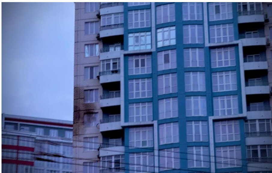
Жилой 22-этажный дом в Одессе получил повреждения