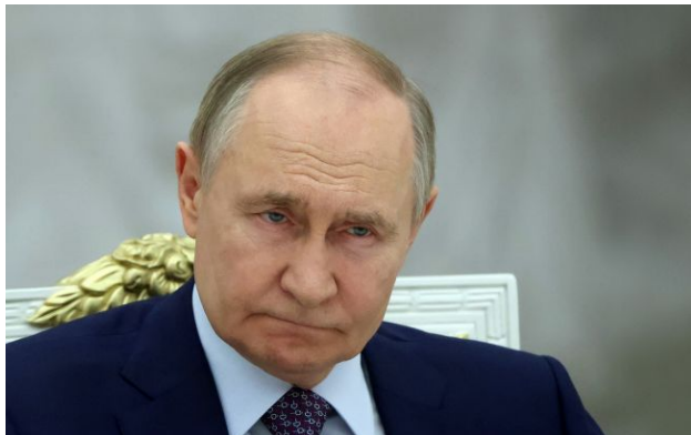
Фото: російський диктатор Володимир Путін (Getty Images)

Російському диктатору Володимиру Путіну не довіряють 24,1% росіян. Ще 23,3% респондентів не схвалюють його діяльність на посаді президента Росії.