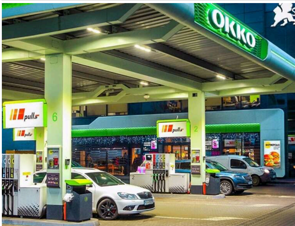
Ілюзія підтримки: як програма паливного кешбеку приховує ріст податкових надходжень та не зупиняє інфляцію