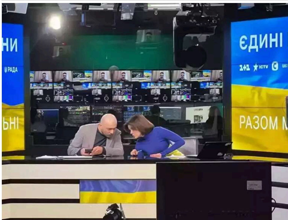
82% ефіру для «Слуг народу»: Держава уклала нові контракти на 638 мільйонів з учасниками телемарафону

ДП «Мультимедійна платформа іновелення України» 22 квітня уклало чотири угоди з телеканалами про створення контенту для марафону «Єдині новини #UАразом» у поточному році на загальну суму 637,96 млн грн.