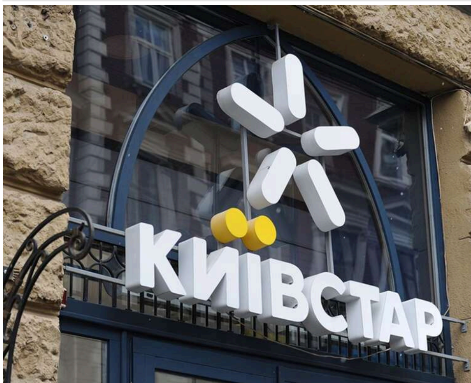
Натиснула «1» і стала боржником: суд зобов'язав киянку виплатити кредит, який оформили шахраї через eSIM

Жінка втратила контроль над своїм номером Київстар після його злomu. Згодом з'ясувалося, що шахраї оформили eSIM і використали SMS-код для підписання кредитного договору на 10 тисяч гривень. Тепер з неї вимагають стягнення цієї суми.