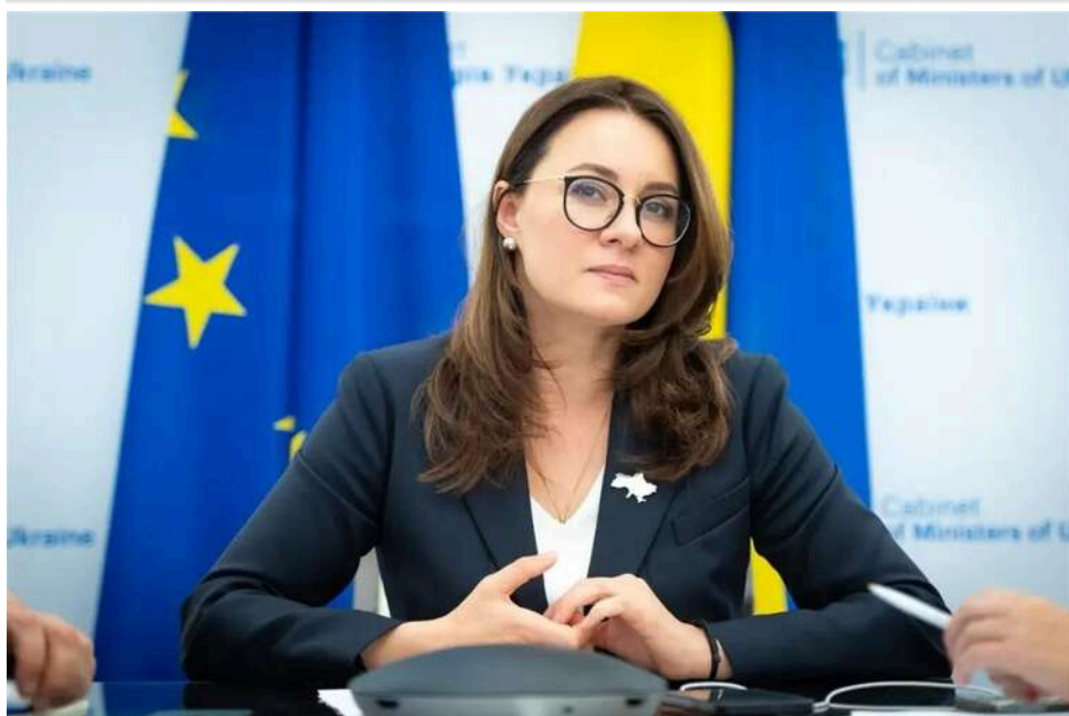
Рада розблокувала понад 1,3 мільярда євро від ЄС: ухвалено ключові закони для програми Ukraine Facility

Верховна Рада прийняла ключові закони, які забезпечують макрофінансову стабільність України, просування до євроінтеграції та виконання зобов'язань перед міжнародними партнерами.