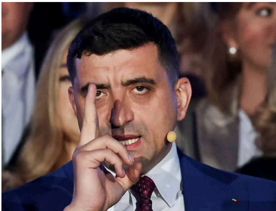
Реванш правих у Румунії: Джордже Сімон використовує політичний хаос, щоб прийти до влади

Джордже Симион прагне влади: праві сили в Румунії посилюють вплив на тлі політичної кризи – Politico.