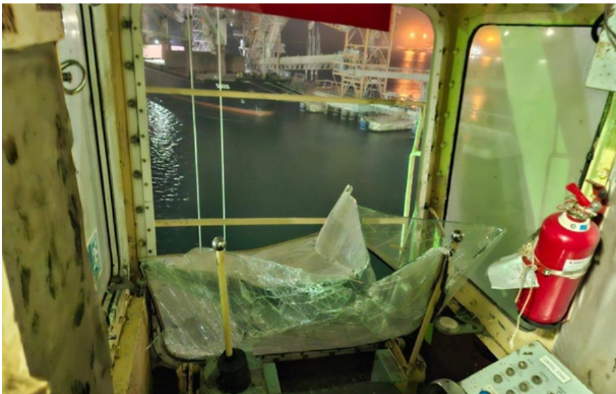
Поврежденное иностранное судно в результате атаки российских дронов

На момент удара РФ суда находились у причалов и были загружены зерном. На территории порта также повреждены зерновой бункер и оборудование.