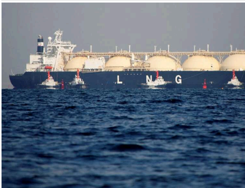
Газ піде вгору: відмова ЄС від закупівель російського ЗПГ збіглася з глобальним дефіцитом